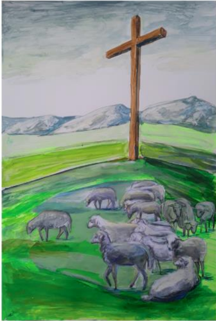
Grafik: Pia Schüttlohr