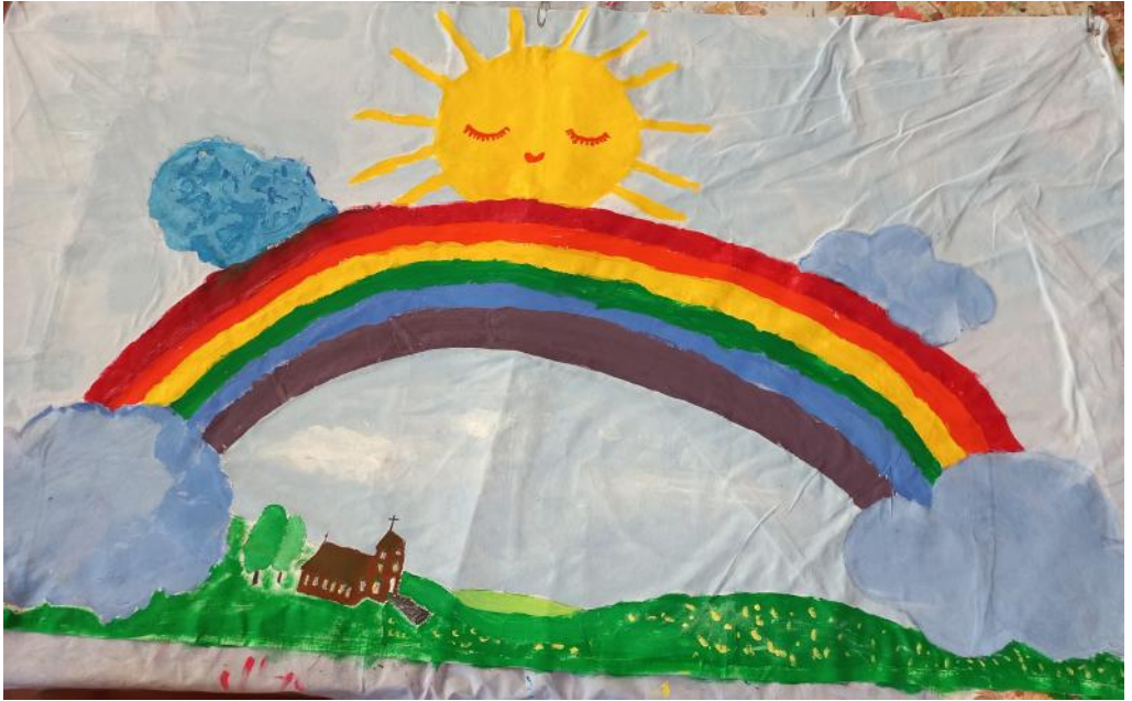
Bild: Kommunionkinder Pannesheide