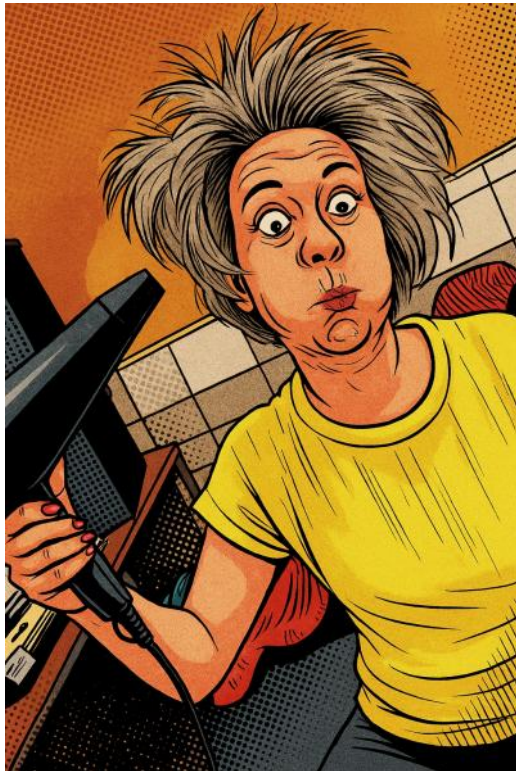
Graphiken: Theater AG St. Katharina Kohlscheid

Zu unserem 40. Bühnenjubiläum laden wir Sie herzlich in einen turbulenten Friseursalon ein. Eigentlich handelt es sich um einen gemütlichen, kleinen Salon, in dem jeder jeden schon lange kennt. Turbulent wird es erst, als sich eine Steuerprüfung ankündigt. Da die Ankündigung erst kurz vor der Ankunft des Steuerprüfers „auftaucht“, ist Eile geboten, denn es gibt eine Menge zu vertuschen. Das wiederum führt in der Verzweiflung zu chaotischen Szenen, bei denen kein Auge trocken bleibt.